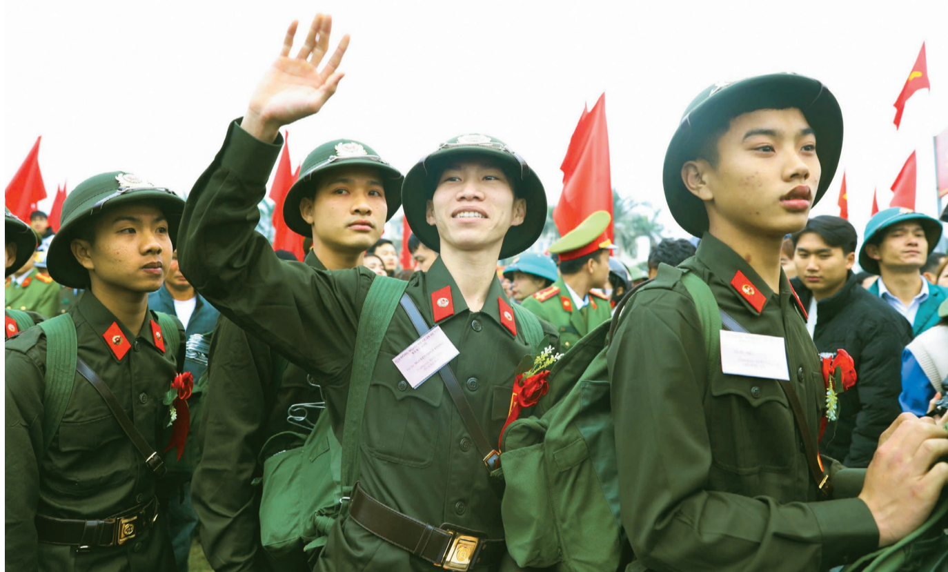
Tiếp bước truyền thống cha anh, 1.568 thanh niên ưu tú của Hà Tĩnh đã lên đường nhập ngũ, mang theo niềm tự hào và quyết tâm cống hiến cho Tổ quốc.