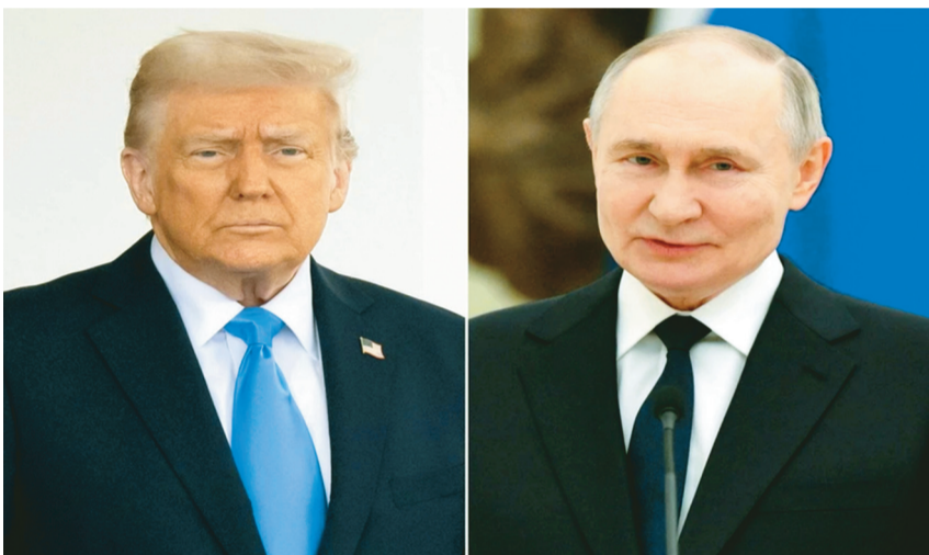
Tổng thống Mỹ Donald Trump (trái) và Tổng thống Nga Vladimir Putin.

Bloomberg dẫn nguồn từ các quan chức giấu tên cho biết Tổng thống Liên bang Nga Vladimir Putin và người đồng cấp Mỹ Donald Trump có thể sẽ gặp nhau tại Saudi Arabia vào cuối tháng 2 này.