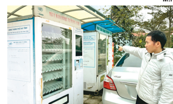
Các máy bán hàng tự động ngừng hoạt động được tập kết tại khu vực đường Nguyễn Công Trứ, thành phố Hà Tĩnh.