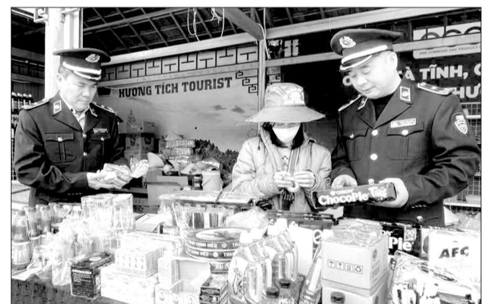
Đội Quản lý thị trường số 2 kiểm tra hàng hóa bày bán tại khu vực chùa Hương Tích.

Ngành chức năng đang tăng cường kiểm tra, kiểm soát các hoạt động kinh doanh hàng hóa, dịch vụ nhằm đảm bảo quyền lợi người tiêu dùng trong mùa cao điểm lễ hội đầu năm.