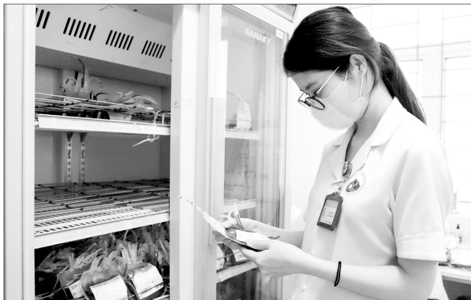
Mỗi đơn vị máu được nhập vào, sản xuất, bảo quản, kiểm định, xuất ra đều qua quy trình nghiêm ngặt.

hiến máu cho bệnh nhân trong trường hợp khẩn cấp.