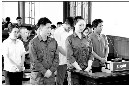
Trước tòa, các bị cáo đều thể hiện sự ăn năn, hối lỗi và mong được sự khoan hồng của pháp luật.