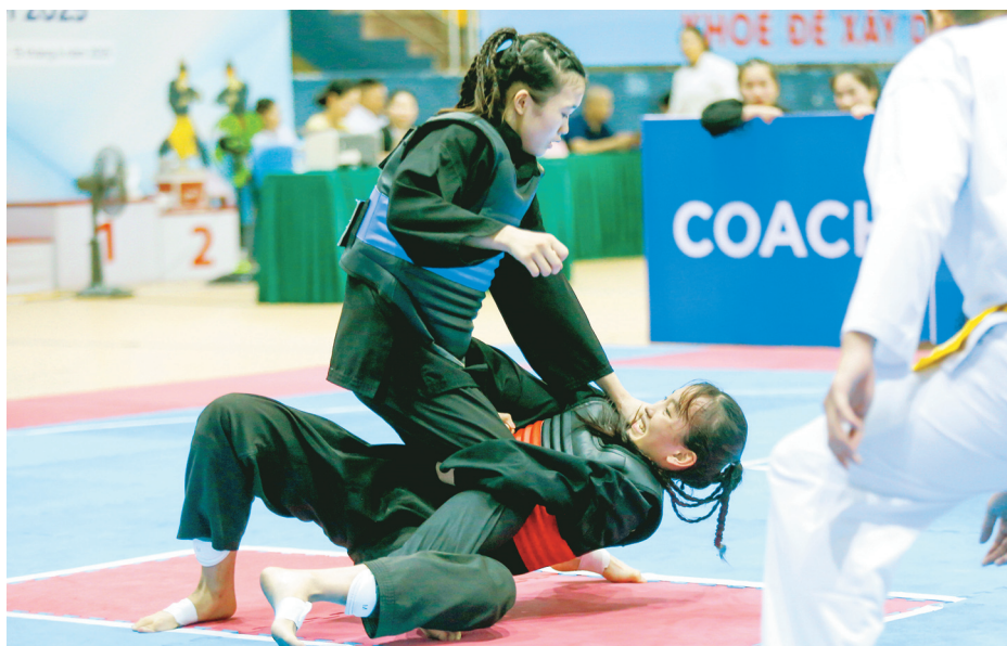
Với sự luyện tập công phu cùng tinh thần thể thao cao thượng, các nữ VĐV đã cống hiến cho khán giả nhiều trận đấu hấp dẫn và đầy kịch tính.