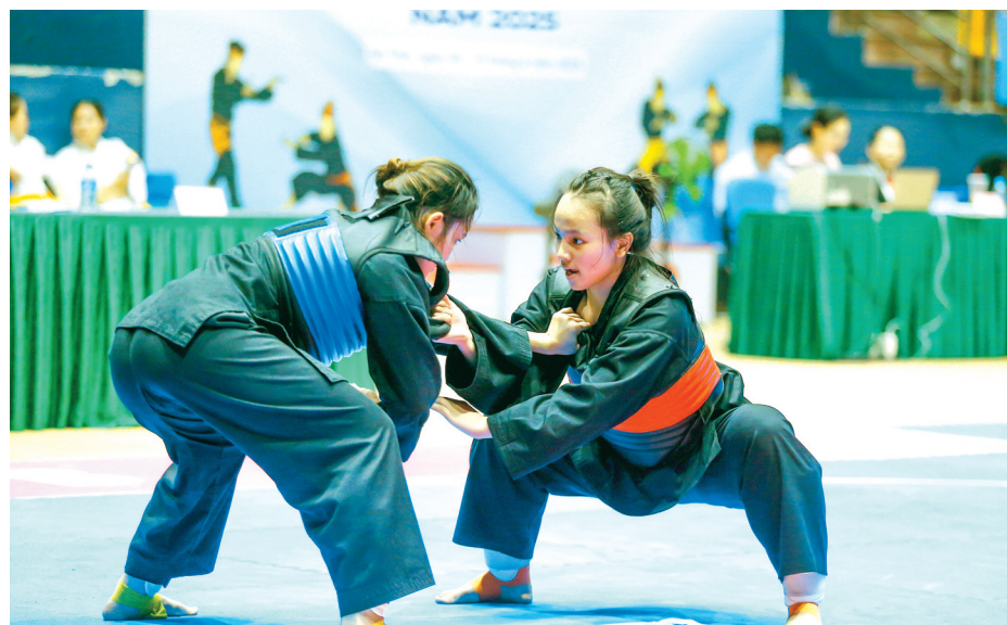
Sự mềm mại của phái nữ kết hợp cùng nét rắn rỏi, dũng mãnh của các đòn thể đã mang đến những nét đẹp rất riêng trên sàn đấu. Chính sự kết hợp thú vị này đã khiến các cô gái và Pencak Silat tìm đến nhau như một lẽ dĩ nhiên.

Trên thảm đấu, các “bóng hồng” Pencak Silat thể hiện tài năng với những đòn đánh mạnh mẽ nhưng không kém phần uyển chuyển. Việc các nữ VĐV chọn theo nghiệp Pencak Silat không còn là chuyện hiếm, các địa phương có phong trào Pencak Silat phát triển mạnh luôn có một lực lượng không nhỏ các nữ võ sinh tập luyện cả 2 nội dung biểu diễn và đối kháng.