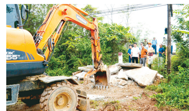
Xã Hương Thủy vừa phối hợp tổ chức lực lượng, huy động máy móc phá bỏ 2 lối đi tự mở qua đường sắt.