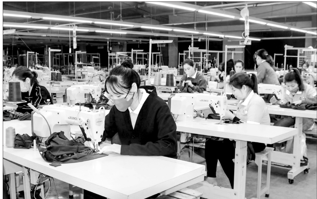
Công ty CP May Five Star Hà Tĩnh đã hoạt động trở lại sau một thời gian tạm dừng sản xuất, kinh doanh.

THÁNG 11/2023, Công ty CP May Five Star Hà Tĩnh (đóng tại Khu công nghiệp Đại Kim, xã Sơn Kim 1, Hương Sơn) tạm dừng hoạt động sau hơn 6 năm thành lập do những khó khăn về hàng hóa và tài chính. Sau khi dừng hoạt động, công ty đã thanh toán lương và các chế độ liên quan cho người lao động. Tuy nhiên, việc dừng hoạt động đã khiến hàng trăm công nhân mất việc làm, mất nguồn thu nhập, ảnh hưởng không nhỏ tới đời sống.