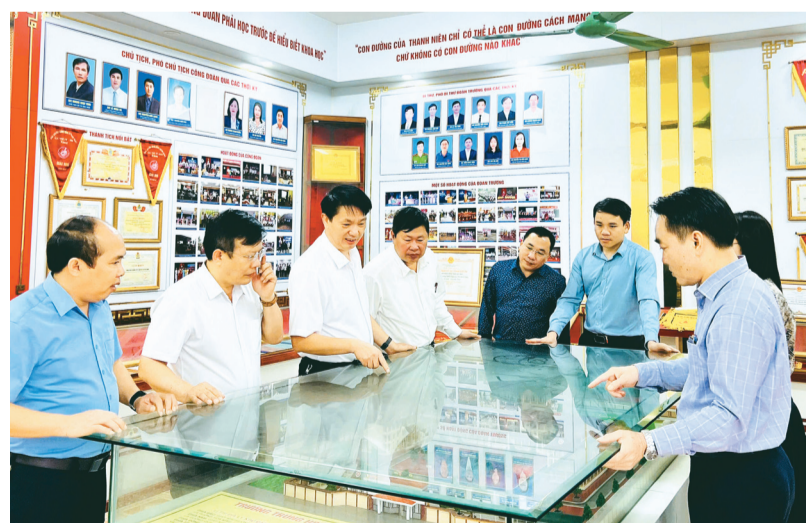
Các đồng chí lãnh đạo huyện Kỳ Anh thăm phòng truyền thống của Trường THPT Nguyễn Thị Bích Châu.