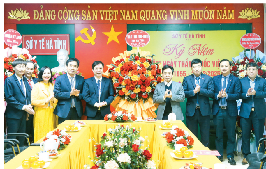
Phó Bí thư Thường trực Tỉnh ủy Trần Thế Dũng cùng các đồng chí lãnh đạo tỉnh tặng hoa chúc mừng cán bộ, nhân viên, người lao động Sở Y tế.

(Xem tiếp trang 2) PHÚC QUANG - DƯƠNG CHIẾN