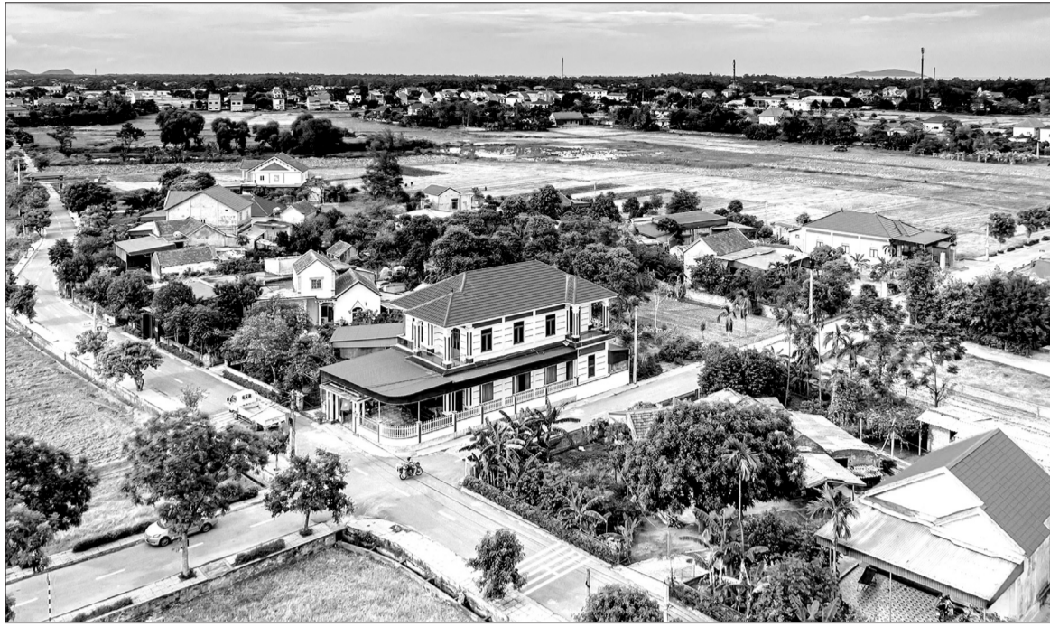
Là địa phương đầu tiên của huyện Nghi Xuân đạt chuẩn xã nông thôn mới kiểu mẫu, Xuân Thành đang hướng đến xây dựng đô thị trong tương lai.