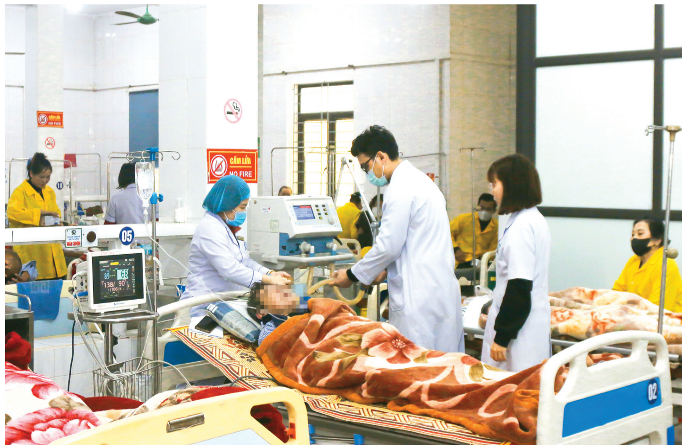
Bệnh viện Đa khoa TX Kỳ Anh đã trở thành địa chỉ tin cậy của người dân trên địa bàn thị xã và các vùng lân cận.