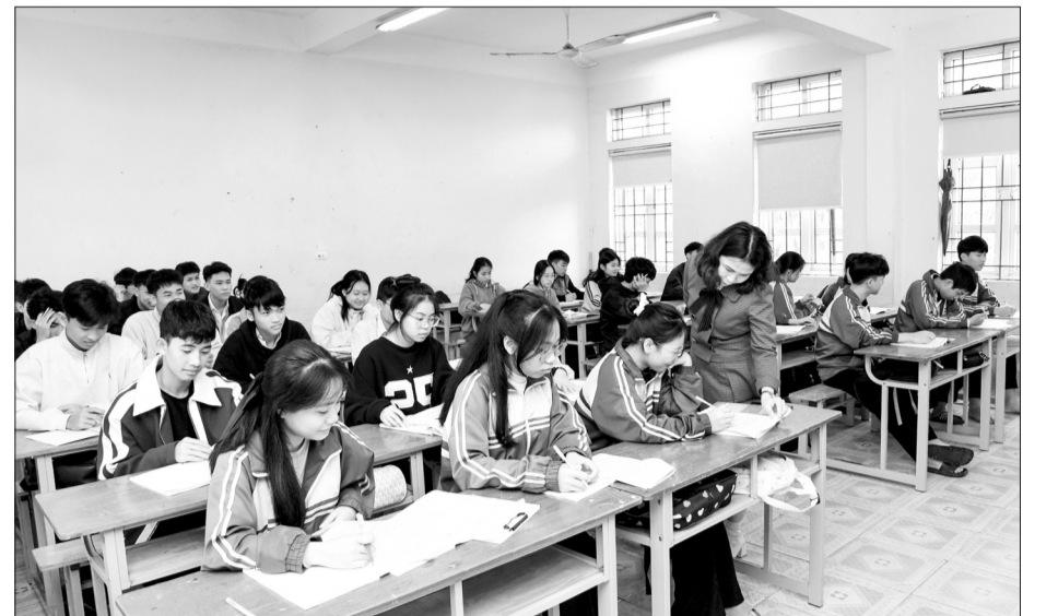
Giáo viên và học sinh Trường THPT Nguyễn Thị Bích Châu không ngừng xây dựng phong trào thi đua "Day tốt, học tốt".

Với đội ngũ giáo viên năng động, sáng tạo, tâm huyết, trách nhiệm, cùng các thế hệ học sinh chăm ngoan, hiếu học, nhiều năm nay, phong trào thi đua "Day tốt, học tốt" ở Trường THPT Nguyễn Thị Bích Châu ngày càng đi vào chiều sâu, chất lượng và hiệu quả. Đặc biệt, trong nhiệm kỳ 2020-2025, Đảng bộ Trường THPT Nguyễn Thị Bích Châu đã lãnh đạo xây dựng đội ngũ cán bộ, giáo viên có bản lĩnh chính trị vững vàng, trình độ nghiệp vụ chuyên môn cao, nhiệt huyết với nghề; tạo ra những thay đổi quan trọng về mặt nhận thức và thực tiễn giáo dục, đưa trường đạt chuẩn quốc gia giai đoạn 2017-2021, tạo điều kiện tốt để nâng cao chất lượng giáo dục toàn diện.