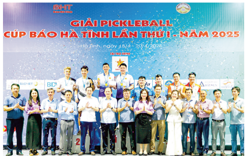
Các đồng chí lãnh đạo tỉnh, đại diện Ban Tổ chức và đại biểu trao thưởng nội dung đôi nam ngoại hạng.

SAU 3 ngày tranh tài sôi nổi, Giải Pickleball Cúp Báo Hà Tĩnh lần thứ I năm 2025 đã thành công tốt đẹp cả về chuyên môn lẫn công tác tổ chức, để lại nhiều