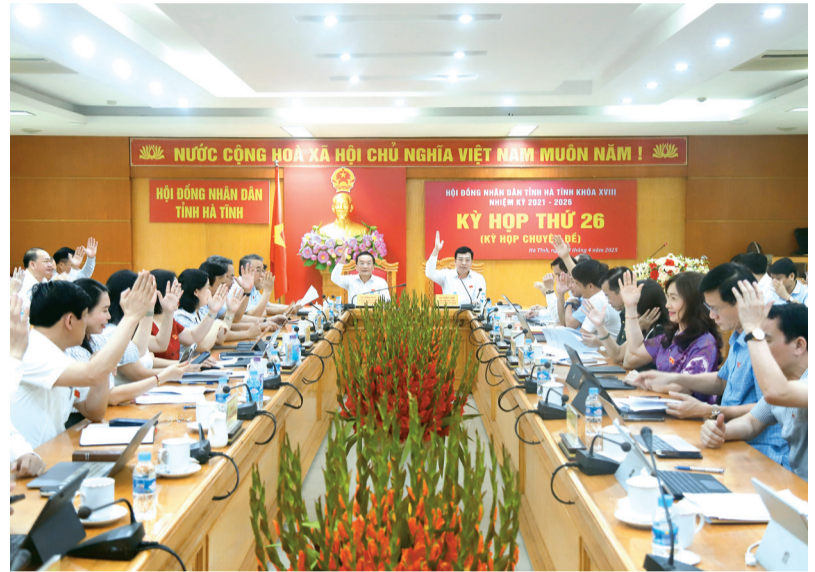
Đại biểu HĐND tỉnh biểu quyết thông qua các dự thảo nghị quyết tại Kỳ họp thứ 26 (kỳ họp chuyên đề).