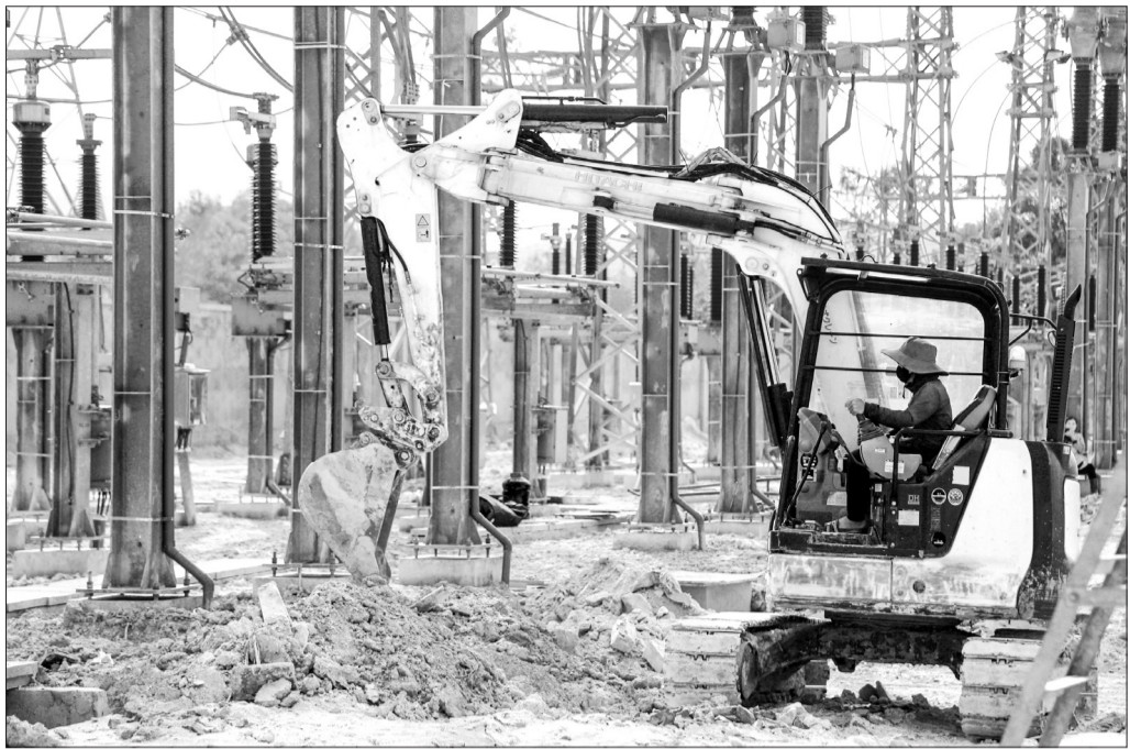
Nhà thầu thi công hệ thống đường giao thông nội bộ tại Trạm Biến áp 220 kV Vũng Áng trên địa bàn phường Kỳ Thịnh (TX Kỳ Anh).

Sau quá trình nỗ lực thi công, đến nay, phần TBA 220 kV Vũng Áng công tác xây dựng đã cơ bản hoàn thành với các hạng mục: nhà điều khiển trung tâm, nhà thường trực bảo vệ, nhà trạm bơm, nhà chứa chất thải, hệ thống đường giao thông nội bộ, thiết bị phân phối 22 kV, 110 kV, 220 kV và máy biến áp được đặt ngoài trời... Hiện nay, chủ đầu tư đang đốc thúc, hỗ trợ nhà thầu thi công tập trung hoàn thành hệ thống đường giao thông nội bộ, phối hợp với các đơn vị chuyên môn để hoàn thành công tác đấu nối, thi nghiệm, nghiệm thu hạ tầng kỹ thuật tại TBA 220 kV Vũng Áng.