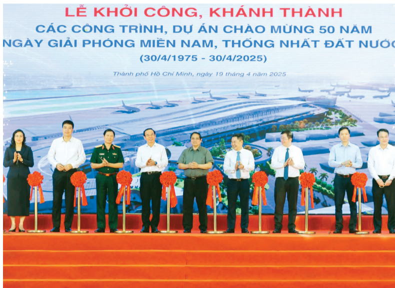
Thủ tướng Chính phủ Phạm Minh Chính và các đại biểu thực hiện nghi thức cắt băng khởi công, khánh thành các công trình, dự án chào mừng 50 năm Ngày Giải phóng miền Nam, thống nhất đất nước.