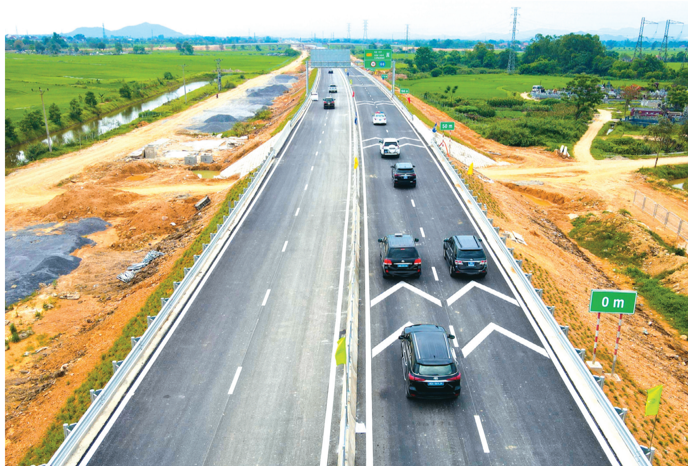
Những chuyến xe đầu tiên vận hành thử trên tuyến cao tốc Bãi Vọt - Hàm Nghi tại lễ thông xe kỹ thuật sáng 19/4.