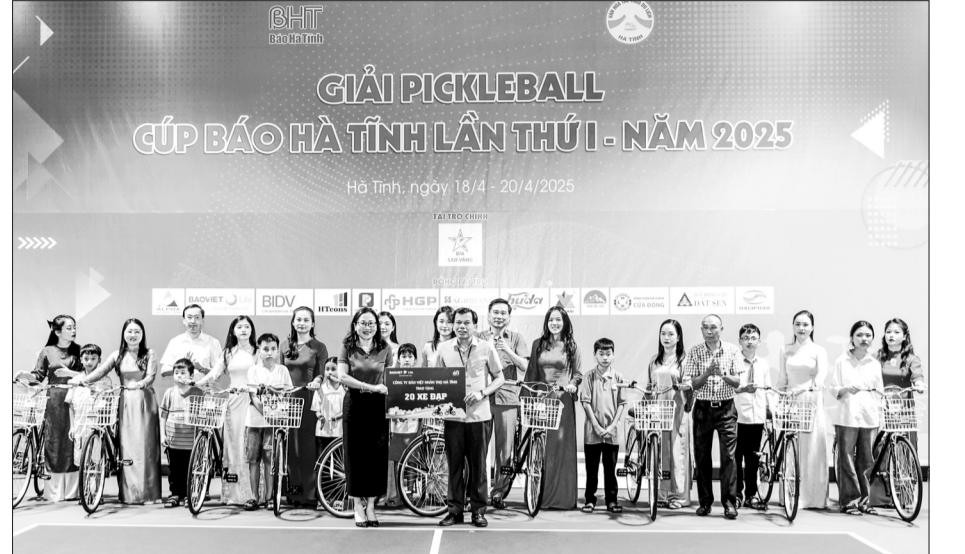
Lãnh đạo Sở VH-TT&DL, Báo Hà Tĩnh chứng kiến nhà tài trợ trao hỗ trợ xe đạp cho học sinh nghèo vượt khó học giỏi.