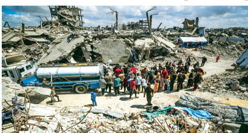
Người dân Palestine xếp hàng chờ lấy nước sinh hoạt tại trại tị nạn ở Dải Gaza ngày 10/4/2025.

Tổ chức Hợp tác và Phát triển kinh tế (OECD) mới đây bày tỏ lo ngại về triển vọng viện trợ phát triển chính thức, khi công bố báo cáo cho thấy tổng vốn viện trợ phát triển chính thức (ODA) trên toàn thế giới năm 2024 giảm lần đầu sau 5 năm tăng liên tiếp, do nhiều quốc gia cắt giảm ngân sách.