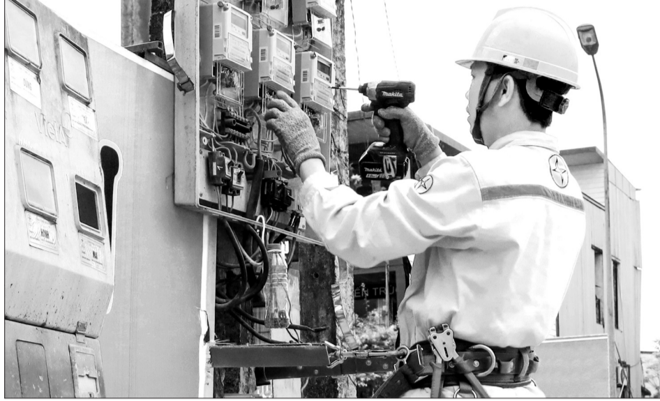
Công nhân Điện lực Hương Sơn kiểm tra thiết bị điện tại trạm biến áp tổ dân phố 9, thị trấn Phố Châu.

Đặc biệt, đơn vị cũng tiến hành kiểm tra, thay thế máy biến áp vận hành lâu năm; nâng cấp tiết điện dây dẫn, thay thế các vật tư, thiết bị không đảm bảo vận hành... để tránh nguy cơ