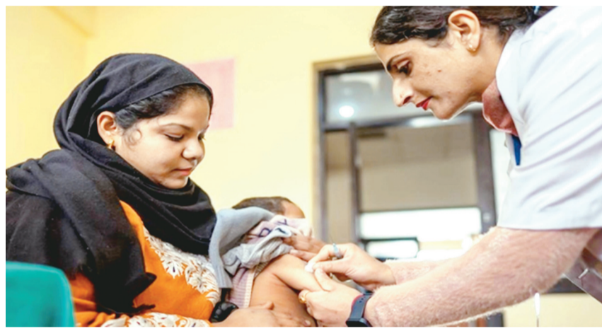
Việc cắt giảm tài trợ toàn cầu có nguy cơ làm gián đoạn hoạt động tiêm chủng ở trẻ em, nhất là tại các quốc gia có thu nhập thấp và trung bình thấp.

Liên hợp quốc cảnh báo tác động tiêu cực của việc cắt giảm tài trợ toàn cầu có nguy cơ làm gián đoạn hoạt động tiêm chủng ở trẻ em, nhất là tại các quốc gia có thu nhập thấp và trung bình thấp.