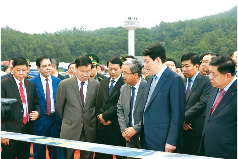
Các đồng chí lãnh đạo Đảng, Chính phủ 2 nước cùng đoàn đại biểu tham quan bến số 3 Cảng quốc tế Lào - Việt.