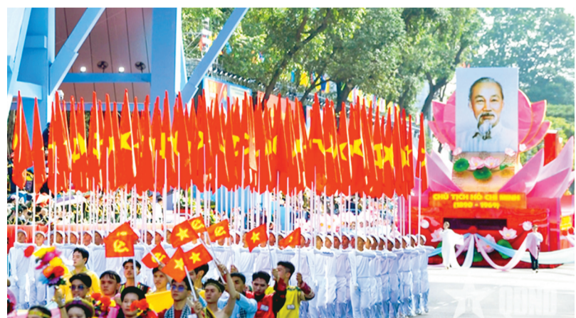
Các lực lượng tiến hành buổi tổng duyệt diễu binh, diễu hành kỷ niệm 50 năm Ngày Giải phóng miền Nam, thống nhất đất nước.

Đã 50 năm đi qua, trái tim tôi vẫn còn rạo rực khi nhớ lại ngày 30/4/1975 - ngày đất nước hát khúc khải hoàn chào mừng miền Nam hoàn toàn giải phóng. Lịch sử dân tộc sẽ không bao giờ quên lá cờ Giải phóng tung bay trên nóc Dinh Độc Lập. Lá