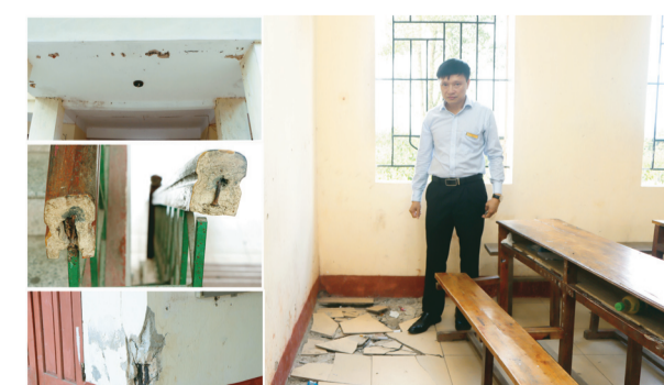
Cơ sở hạ tầng Trung tâm GDNN-GDTX Cẩm Xuyên xuống cấp nghiêm trọng.