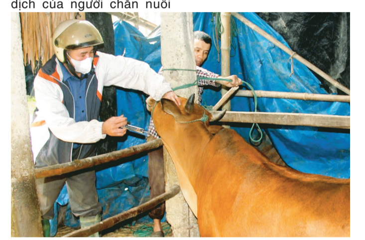
Kết quả tiêm phòng cho đàn vật nuôi tại Hà Tĩnh vẫn còn đạt thấp.

ngành phòng chống và hạn chế thiệt hại do dịch bệnh gây ra, Sở NN&MT đã