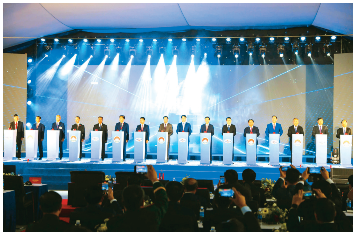
Các đồng chí lãnh đạo 2 nước Việt Nam - Lào, lãnh đạo tỉnh Hà Tĩnh và tỉnh Bolikhamxay thực hiện nghi thức khánh thành bến số 3 Cảng quốc tế Lào - Việt.