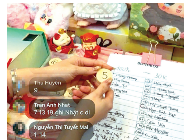
Mini game thử vận may để mua hàng giá rẻ đang "rộ" lên ở Hà Tĩnh trong thời gian gần đây.