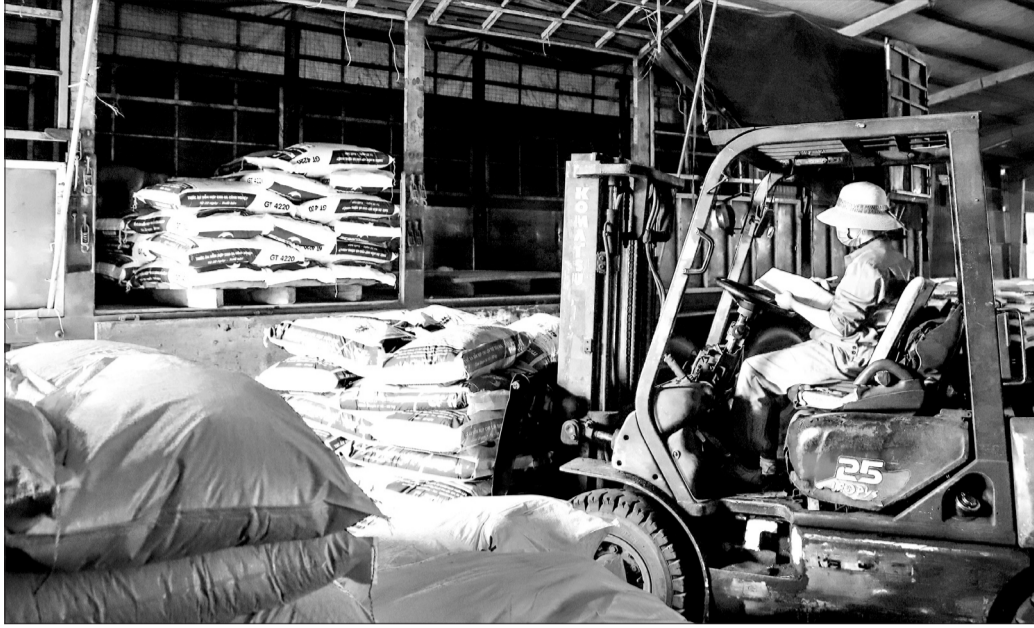
Công nhân Công ty CP Thức ăn chăn nuôi Thiên Lộc kiểm tra hàng hóa trước khi xuất kho.

Công ty Điện lực Dầu khí Hà Tĩnh đang huy động vận hành liên tục, ổn định 2 tổ máy phát điện tại Nhà máy Nhiệt điện Vũng Áng 1 (Khu kinh tế Vũng Áng) sau quá trình tạm ngừng hoạt động phục vụ công tác bảo dưỡng, sửa chữa đợt tết Nguyên đán Ất Tỵ. Để đảm bảo duy trì chuyển sản xuất, DN tiếp tục phối hợp chặt chẽ với Tập đoàn Điện lực Việt Nam và Trung tâm Điều độ hệ thống điện quốc gia đảm bảo sẵn sàng huy động tối đa công suất; phối hợp Công ty Cung ứng Nhiên liệu Điện lực Dầu khí để chủ động nguồn nhiên liệu than phục vụ dây chuyền sản