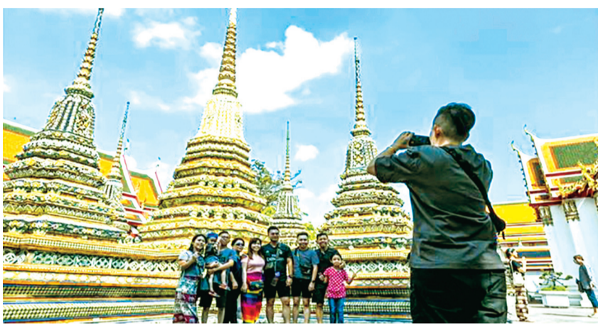
Ngành du lịch Thái Lan đang gặp nhiều khó khăn trong thu hút du khách.

Tham vọng của Thái Lan trong việc thu hút tới 9 triệu du khách Trung Quốc trong năm 2025 đang đứng trước nguy cơ khó thành hiện thực, nhất là sau khi một nam diễn viên Trung Quốc bị bắt cóc đưa sang Myanmar.