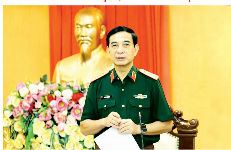
Bộ trưởng Bộ Quốc phòng Phan Văn Giang được Thủ tướng Chính phủ phân công làm việc với 2 tỉnh Hà Tĩnh và Thái Nguyên về sản xuất, kinh doanh, đầu tư xây dựng và xuất nhập khẩu trên địa bàn.