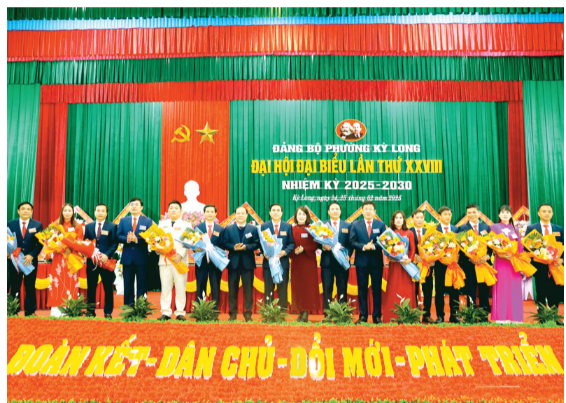
Lãnh đạo Ban Tổ chức Tỉnh ủy và Thường trực Thị ủy Kỳ Anh tặng hoa chúc mừng Ban Chấp hành Đảng bộ phường Kỳ Long nhiệm kỳ 2025-2030.