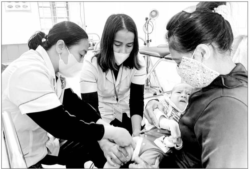
Các y, bác sĩ Trạm Y tế xã Thanh Bình Thịnh (Đức Thọ) tiêm vắc-xin phòng sởi cho trẻ.

Trước diễn biến phức tạp của một số loại dịch bệnh, ngành Y tế Hà Tĩnh đã triển khai các giải pháp phòng chống, đồng thời khuyến cáo người dân cần chủ động tiêm vắc-xin phòng bệnh.