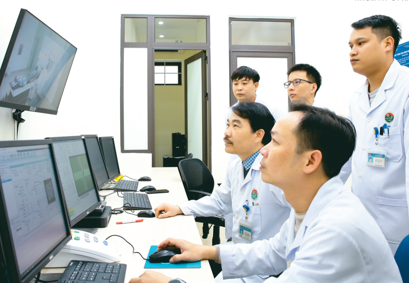
Các bác sỹ Khoa Ung bướu - Y học hạt nhân (Bệnh viện Đa khoa tỉnh Hà Tĩnh) tiến hành xạ trị cho bệnh nhân.